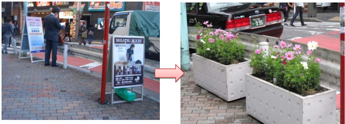
あおい書店前のガードレール前

(3) 花を飾る行為は美化への啓蒙となります。ゴミのポイ捨てや放置自転車、違法看板、タクシーの駐停止が減りました。また、さくら通り（さくら坂）の歩道も広くなり町的美観の推進につながりました。