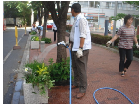
最後の水やりはコンテナの下から 水が溢れるまでたっぷりと。