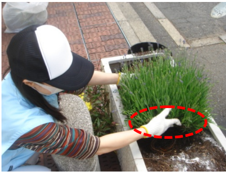
根が土の上になないように しっかりと植え込む。